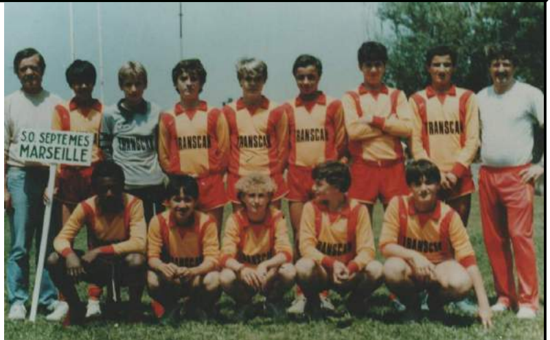
Le S.O.Septèmes avec Zinedine Zidane (Les bras croisés) en 1987

En 1984, le 4ème Tournoi international de l'Aspre oppose, sur le bon vieux stade Violet, des équipes pupilles et minimes venues déjà, de différents pays d'Europe : Onex (Suisse), Coventry (Angleterre), Olot (Espagne), mais aussi Montpellier la Paillade, Alès, Narbonne, Perpignan, Canet en Roussillon et le SO Septème qui compte dans ses rangs un certain Zinedine Zidane. "Zizou" et ses copains remporteront le trophée pour leur 1ère participation. En 1998, le journal "L'Equipe" faisait un article sur "Zizou" et évoquait son séjour à Thuir lors de ce 4ème Tournoi International de l'Aspre : " L'un des moments les plus forts, c'est le déplacement à Thuir, près de Perpignan, où les joueurs du SO Septème participent au tournoi de Pentecôte 1985.